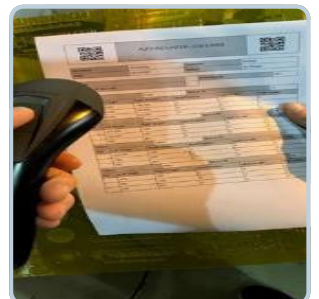
Scanner de code-barres