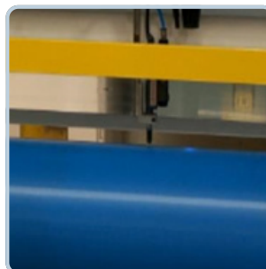
Capteur de contact TIR