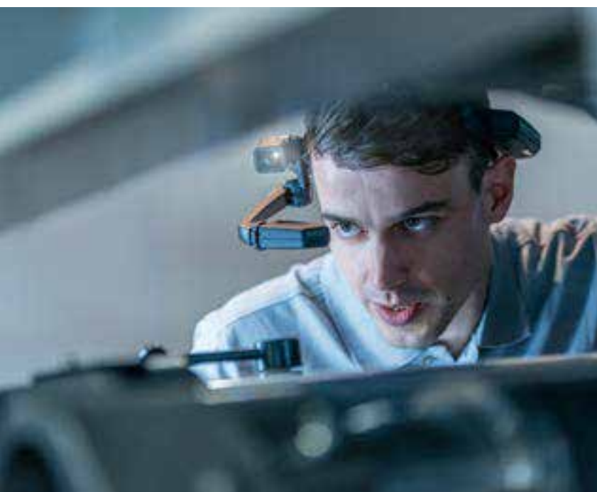
AR-Dataglass – Service à distance pour votre presse d'impression

La nouvelle configuration du système WashTronic optimise l'envoi d'encre et permet un changement rapide de couleur. Moins d'encre dans le circuit assure une augmentation du niveau de productivité en particulier avec les courts tirages. La disposition intégrée du système minimise les espaces d'exploitation tout en assurant une flexibilité maximale et une ergonomie opérationnelle.