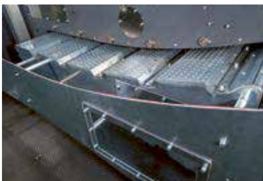
Tunnel de séchage à deux niveaux avec un faible encombrement et une exceptionnelle capacité

Dans la phase finale du séchage de l'encre, le nouveau tunnel joue un rôle important dans la capacité de séchage et est particulièrement bénéfique lors de l'utilisation d'encres à base d'eau sur des films plastiques. Le concept est basé sur un arrangement à deux niveaux des éléments de séchage qui réduit considérablement l'empreinte de la machine. En outre, sa compacité a réduit la longueur totale du passage de bande dans la machine de façon à réduire de manière significative les déchets lors du démarrage de l'impression. En même temps, grâce à la nouvelle conception des deux circuits de séchage, l'accessibilité aux unités de séchage a été améliorée, simplifiant toutes les tâches de maintenance.