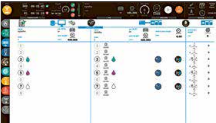
Interface homme-machine (IHM)

En outre, Koenig et Bauer a adopté une approche révolutionnaire de la flexographie CI en termes d'optimisation du flux des matériaux dans le processus d'impression. Le chargement et le déchargement des bobines sont complètement séparés, ce qui simplifie la production. Cette nouvelle stratégie peut rendre la logistique périphérique des machines plus efficace dans le processus de production et accroître sa sécurité en même temps.